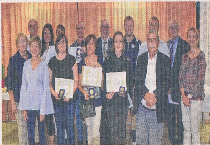
Les médaillés du CASH, les représentants de la jeunesse et des sports et les élus.

Le club fonctionne avec un budget de 250 000 euros, mais à ce chiffre, vient s'ajouter la part évaluée, mais non payée, des heures de bénévolat des 30 bénévoles soit, au sein des 11 sections, 8 170 heures. Le montant de ces contributions volontaires est de 210 000 euros, qu'il faudrait ajouter au budget si le bénévolat cessait. Le CASH compte 1 012 licenciés. Si 67% des licenciés sont issus de